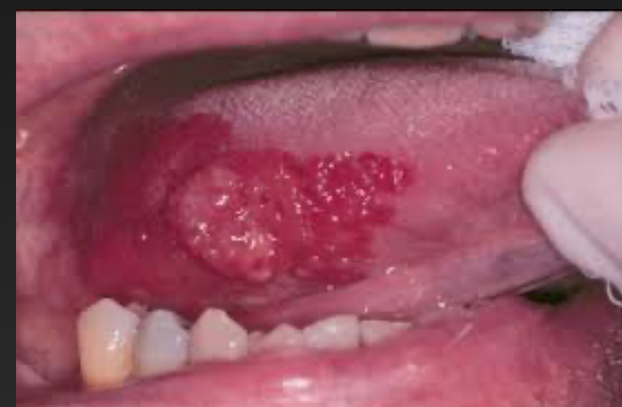
Erythroplakie mit Plattenepithelkarzinom